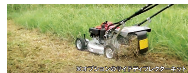
※オプションのサイドフレクターキット